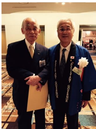
一番乗りの美崎会員と瀧川ガバナー補佐